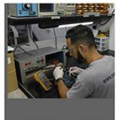
CALIBRAÇÃO/AFERIÇÃO DE EQUIPAMENTOS MAGNÉTICOS, ETC