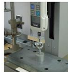
TESTE DE CARGA (DINAMÔMETRO)