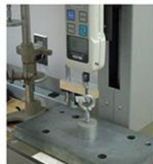
TESTE DE CARGA (DINAMÔMETRO)